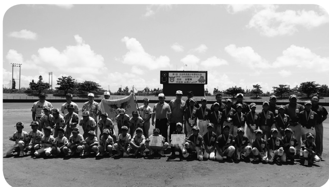
優勝チーム 古堅南少年野球クラブ 準優勝チーム 山田ジュニアクラブ

大会当日は猛暑の厳しい中での試合となりましたが、少年野球らしく元気溢れる全力プレーが見られ、出場した各チームの絆を深めた大会となりました。