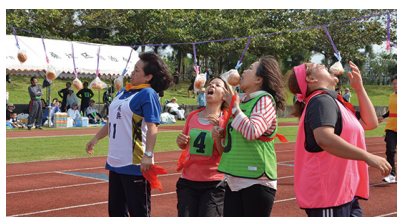
女子ミックスリレー（パン食い）