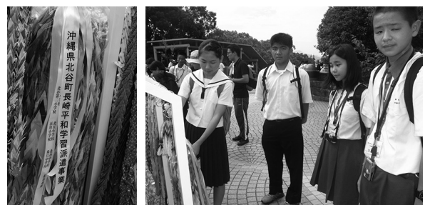
長崎 ▲千羽鶴を献納しました！！