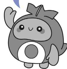
北谷町イメージキャラクター ちーたん