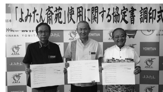
▲使用協定に関する調印式の様子

読谷村が親志地区(多幸山)にて建設を進めていました火葬場がこのほど完成し、平成28年10月から北谷町民も利用できるようになります。料金などは下表を御覧いただきますよう御案内します。