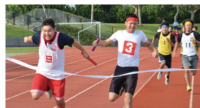
各自治会の名誉をかけて・・・