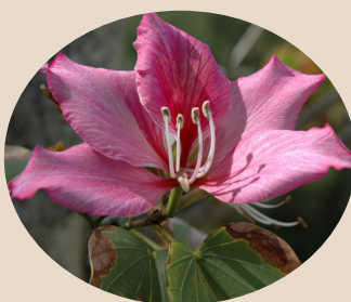
町花フィリソシンカ