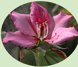
町花フィリソシンカ