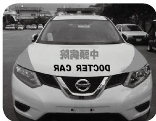
▲前を走る車のドライバーがルームミラーで確認できる鏡文字を使用。

運用時間は 年末年始と休日を除く平日 午前9時から 午後5時まで となっております。