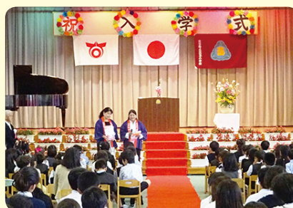
▲北玉小学校入学式での贈呈式

商工会女性部では、昨年は北谷町で飲酒運転による死亡事故があり、子どもたちが悲惨な事故に巻き込まれないように祈願しながら、交通安全のお守りを心を