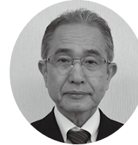
▲北谷町教育委員会 教育長 川上 啓一 (2期目)