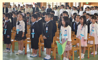
▲北谷小学校入学式の様子

導入に至った経緯として、町教育委員会では、町校長会及び教頭会を実施する中で、導入に向けて学習会などを実施し、各学校の校長から賛同を得られ、足並みをそろえた形で始めることができました。