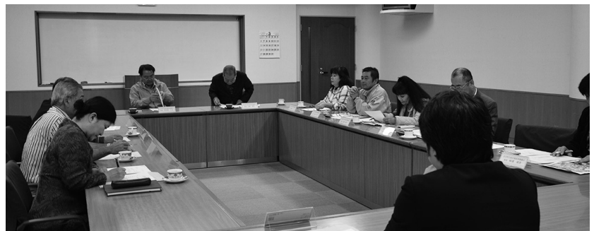
北谷町行政区域改善審議会の様子