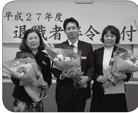
▲北谷町発展のためにご尽力された退職者の皆様、お疲れ様でした。