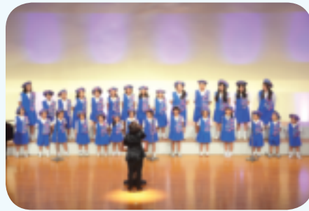
平和コンサートでの北谷町少年少女合唱団「夢」による合唱の様子。