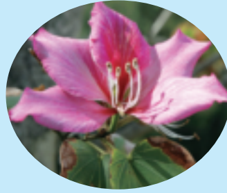
町花フイリソシンカ