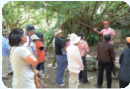
北谷町と近隣市町村の戦跡遺構巡りの様子。