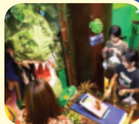
迷路途中のアトラクションの様子。

期間中は、多くの子供達や保護者が訪れ、本格的な迷路や途中のアトラクションを楽しみました。