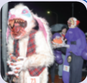
他の参加者の子供が逃げ出すほどの仮装も。

10月31日(水)、美浜アメリカンビレッジ内広場において、仮装コンテストが行われました。会場は老若男女問わず、思い思いの衣装に身を包んだ参加者と、それを見に来た観客で賑わい大盛り上がりでした。