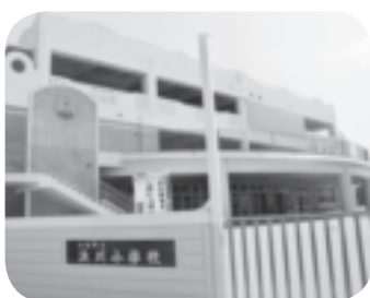
改修後の浜川小学校。

平成23年度の決算額が、前年度決算額を大きく上回った主な要因としては、歳出面については、児童の学習環境の改善を図るため、浜川小学校校舎改築事業に取り組んだほか、伊礼原遺跡の国史跡指定に伴い用地取得を行ったことなどがあげられます。歳入面については、前述の小学校校舎改築事業や遺跡用地取得事業の財源とするための国庫支出金や町債が増となっております。 また、町の基幹財源である町税については、個人町民税がほぼ横ばいだったのに対し、固定資産税は土地の負担調整措置や新築家の増加により増収となっており、町税全体では約2億3千万円の増となっております。