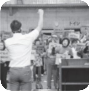
参加者全員によるがんばろう三唱の様子。

10月30日(火)北谷公園屋内運動場にて、オスプレイ即時撤去・女性暴行致傷事件抗議北谷町民大会が開催されました。