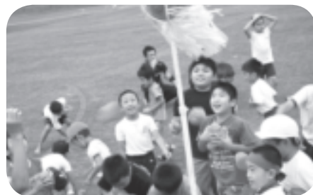
幼稚園児、小学校低学年女子、小学校低学年男子で対抗戦の玉入れ競技。