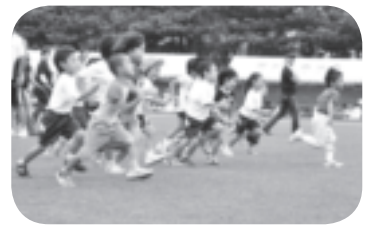
かけっこ (お菓子とり競争)