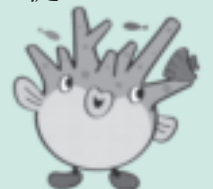
大会キャラクター アバサンゴ