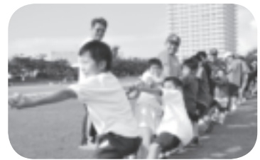
綱引き (全員参加です♪)