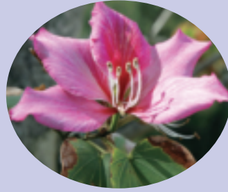
町花フイリソシンカ