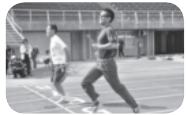
職域リレー (真剣勝負です☆)