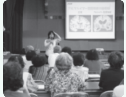
北玉区での講演会の様子

参加者の皆さんからは「このような勉強は時々したほうがいいね」「病院に行くことも大切なんだね」「まずは予防からだね」等の声がありました。