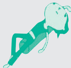
ストレッチポールでリラックス