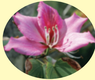
町花フイリソシンカ