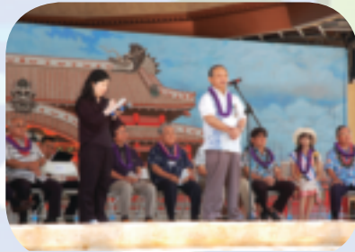
▲ハワイ沖縄フェスティバルに参加し、表敬の挨拶を行いました。