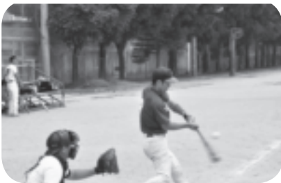
5月13日 軟式野球競技