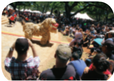
▲ハワイ沖縄フェスティバルへは、毎年2日間で約5万人が参加します。

鍾乳洞が崩壊してできた谷間に広がる自然豊かな森の中を歩きながら、心地よい汗を流し、親子や区民との親睦もはかれ、とても素敵な一日でした。