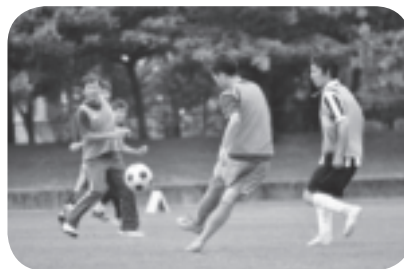
6月3日 サッカー競技