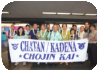
▲ホノルル空港に到着し、ハワイ北谷町嘉手納町人会の歓迎を受けました。