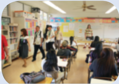
▲子ども達の交流の可能性を探るために、教育機関への視察も行いました。