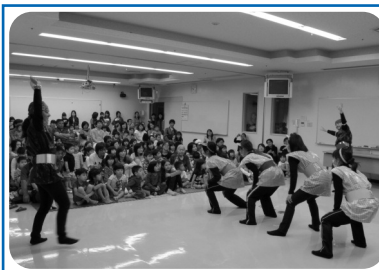
人形劇鑑賞会 5月15日 出演:金武町保育士サークル「びよびよ」