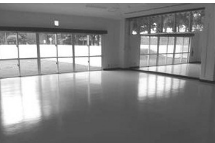
▲広々としたフィットネススタジオ