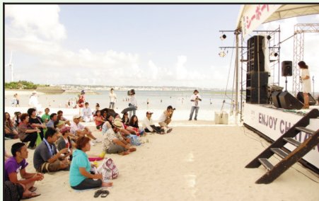
▲海辺で行われる インディーズミュージックコンテスト

(シーポート特設サイトへ http://seaportchatan.ti-da.net/ )