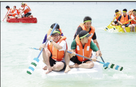
▲名物のイカダ障害物競走