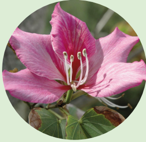
町花フィリソシンカ