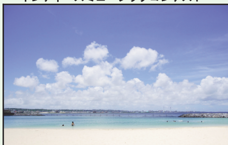
▲好きですちやたんの海