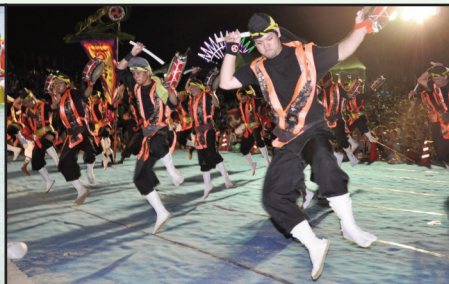
▲北谷町伝統の「エイサー」