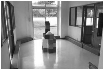
▲子どもが遊べるキッズルームも用意