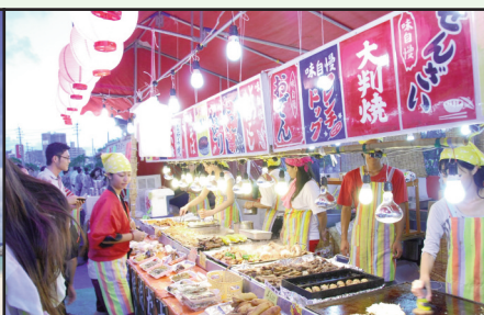
▲祭りの美味しい匂いに誘われて