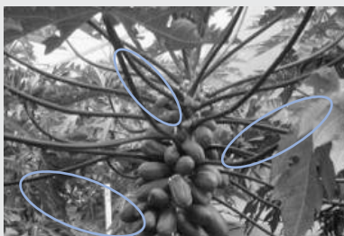
・葉柄が紫色もしくは赤色