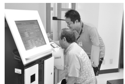
▲いつでもスタッフが機器の使い方をお教えます