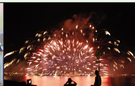
▲北谷の海を彩る水上花火