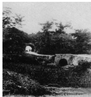
▲ チャタントンネル・ビジュアル 画・比嘉昌信氏