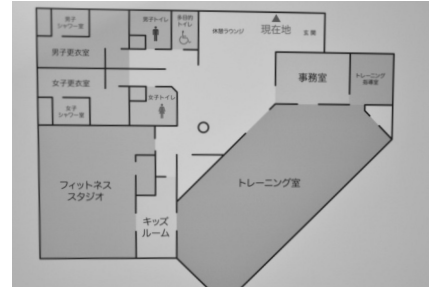
▲トレーニングセンター見取り図