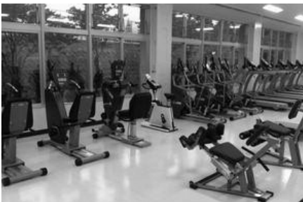
▲人気のランニングマシン等多数取り揃え

施設内容としては、最新のトレーニング機器を取り揃えたトレーニングルーム、エアロビクス、ヨガ、体操など様々な用途に対応可能なフィットネススタジオ、小さなお子様を遊ばせておくことができるキッズルーム、シャワー・更衣室も完備しております。