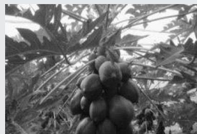
・葉柄が白色もしくは緑色