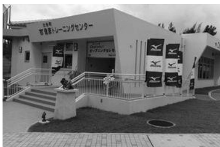
▲トレーニングセンターの愛称は「ちゃとれ」です。