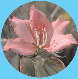
町花フィリソシンカ