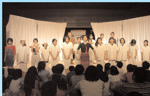
子どものための朗読劇開演

子ども達の安全を守るためにも、チャイルドシートの正しい装着と安全運転をみんなで心がけていきたいですね。