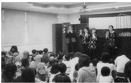
「人形劇団花かご公演」