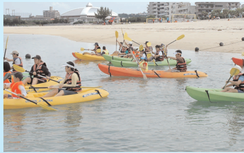
気持ちはもう夏本番!

生涯学習プラザ主催の親子シーカヤック体験講座がアラハビーチで、6月10日(日)に行われ、約30組の親子が参加しました。