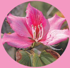
町花ファイリソシムカ