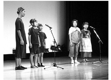
出演：劇壇たのシーサー、 ことばの玉手箱 夏休み最後の日曜日、楽しいひとときを過ごせたね！