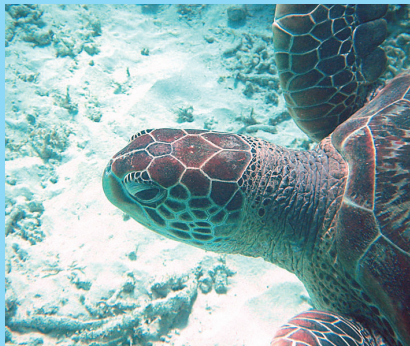
渡嘉敷島に住み着いているウミガメ

海の中には、ウミガメやクマノミなど心を癒してくれる可愛い生き物もいっぱいいるよ！