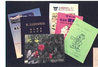
町の刊行物や地域の資料

企画展の開催、広報ちやたんやホームページなどを通して、公文書館や所蔵資料の情報発信しています。