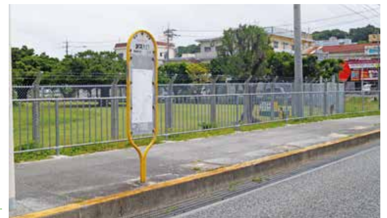
待ち望む！謝刈入口バス停への屋根設置