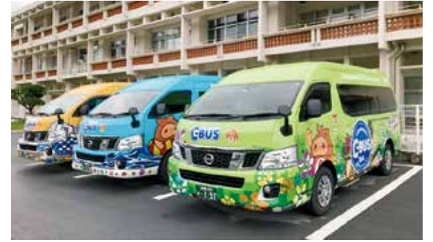
高齢者に優しいコミュニティバスの運行を