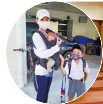
「新生児への定額給付金」で支援を!