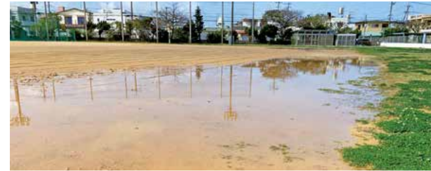
水たまりの早急な対策が望まれる浜川小学校運動場

問 砂塵対策として小中学校の一部芝生化の今後の計画は 答 グラウンドや学校施設の配置状況、体育の授業や部活動と、周辺の環境なども勘案しながら、芝生化に限らず、有効な砂塵対策を検討する。