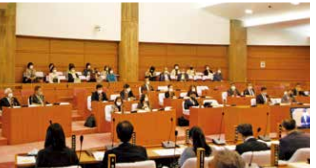
多くの住民が「新生児への定額給付金」のゆくえを見守る

問 町内2団体による「新生児への定額給付金」の陳情を3千565人分の署名を添え町長に提出。議会でも決議が議決された。3千565人分の思い、議会の総意はどのよ 答 町内初となる保育所等従事者慰労金給付事業及び同保育所等従事者へのPCR検査事業に取り組んだ。 問 課長級以上の女性職員登用を伸ばす取組は 答 新たに女性管理職2人の配置を予定。管理職の女性登用率は13%。次世代の管理職候補を人材育成。 問 外国人も共に暮らしやすい社会について