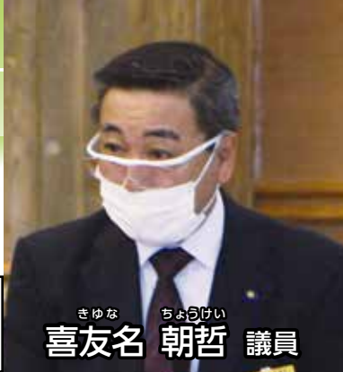
北谷 喜友名 朝哲 議員