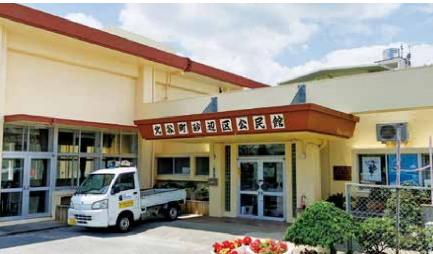
公民館を含む公共施設全体へのWi-Fi環境の整備拡充を!

問 砂辺区、沖縄防衛局との協議や公募の進捗状況、今後の活用計画は 答 昨年12月22日に副町長が同局管理部長と面談をし、砂