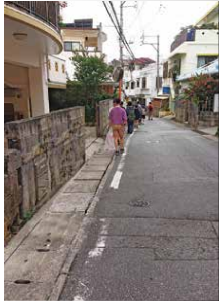
北玉小学校通学路にグリーンベルトの早急な設置を