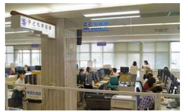
新たな子育て世代への支援策を望む!

2020年の出生数は 2020(令和2)年、本町における出生数は、出生者合計は293人。