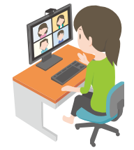
選挙期間の職員の勤務状況

問 選挙において職員等の勤務実態と選挙管理委員長辞職の経緯と今後の対応は 答 前選挙管理委員長の辞任願及び退職願の理由は一身上の都合。国民審査の開票は独自作成したプログラムを使用していたが従来システムでは対応できないため今後は全国自治体で事例がある読取集計機を導入予定。