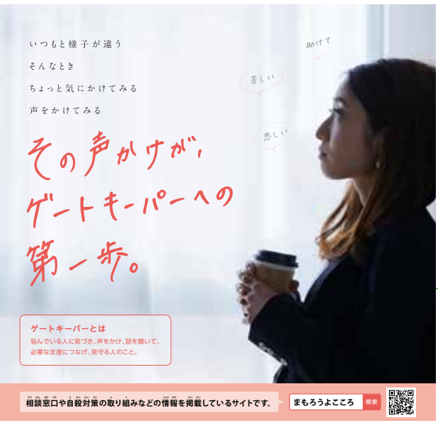
誰もが自殺に追い込まれない社会の実現を (厚生労働省ホームページより)

問 学校周辺における交通安全対策については、通園通学中の幼児及び児童・生徒の交通事故を防止する観点から非常に重要である。 答 学校周辺における交通安全対策については、通園通学中の幼児及び児童・生徒の交通事故を防止する観点から非常に重要である。車道路面への「30キロの速度標識」、「速度落とせの標識」及び「狭窄標識」の設置し、既に工事を完了。英語版の標識につきましては、土木課と設置に向けて協議中。