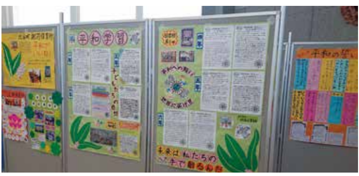
平和ガイドの育成と戦争の悲惨さ・命の大切さの継承を望む

問 県立高校の男子生徒が自殺した事案について教育委員会の見解は 答 戦争の悲惨さや命の大切さを次代へ継承していくための学習機会を創出し学習コンテンツとして活用を図る。人材育成推進のため北谷町ピースメッセンジャー認定事業を実施予定。