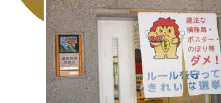
選挙管理委員会のスムーズな運営を

問 砂辺区、沖縄防衛局との協議や公募の進捗状況、今後の活用計画は 答 昨年12月22日に副町長が同局管理部長と面談をし、砂