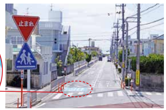
スピードを守れスクールゾーン

問 ワクチン接種場所と町内医師と看護師の人数は 答 ワクチンの接種場所は、個別接種が最大で9医療機関、集団接種はニライセンターを想定。町内の医師及び看護師の人数は、個別接種については、各医療機関に協力を依頼中、集団接種の実施は、中部地区医師会とおして、医療従事者を派遣。中部市町村の担当者及び医師会と交渉を行っている最中で把握していない。 問 接種順位は医師・看護師65歳以上・患者・一般町民で予定人数は 答 接種の優先順位は、医療従事者が約860人、65歳以上は約5千900人、基礎疾患は約1千800人、高齢者施設等の従事者は約430人、一般の方は約1万4千360人を想定。 問 浜川小学校スクールゾーン 答 路面に30を表示すること、英語版の標識を立てられないか伺う