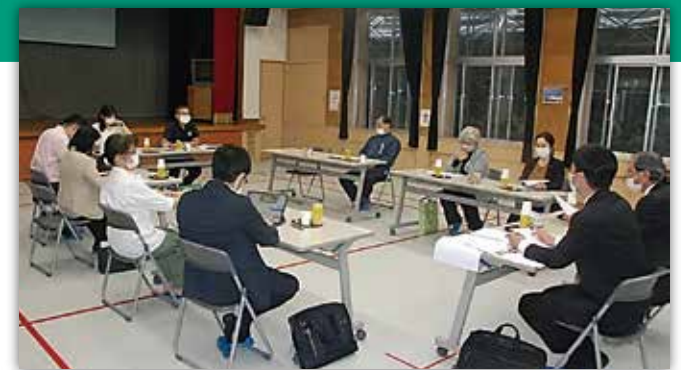
文教厚生常任委員会 所管事務調査を実施