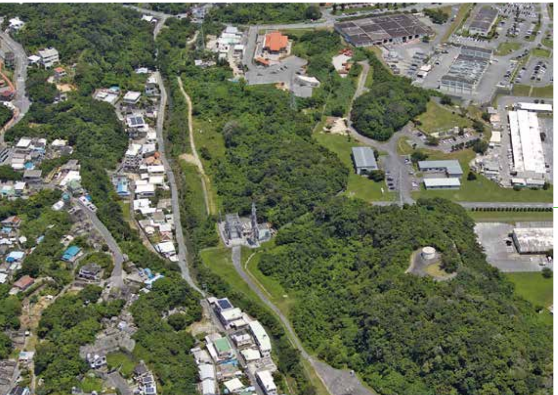
キャンプ瑞慶覧の跡地利用の進捗は

認。現段階では、両者の思惑や開発条件が合致、良好な関係・信頼をもって開発が進めると期待。引き続き同委員会、企業と意見交換を重ね、当地区全体の不利益がでないよう適切な跡地利用の推進を図る。 問 町立博物館の整備は、民間活力導入の検討、今後のスケジュールを問う 答 町立博物館整備事業は、「北谷町の歴史・文化・自然を未来につなぎ、北谷・文化発信拠点」を基本コンセプトに、国指定史跡である伊礼原遺跡と連携した施設整備を行う。今年度より設計の見直し、良い施設整備して、あらゆる事業手法の検討も必要と内閣府支援事業のサポートを受けている。また、民間事業者のノウハウ・アイデア等の活用による、集客力・サービスレベル向上を目的とする民間活力の導入を検討した。現在、伊礼原遺跡と博物館を一体的に管理に向け、効率的な運用を目的とする、指定管理者制度の活用、伊礼原遺跡の来訪者、博物館の来館者向けの便益施設として、館内への飲食店等の検