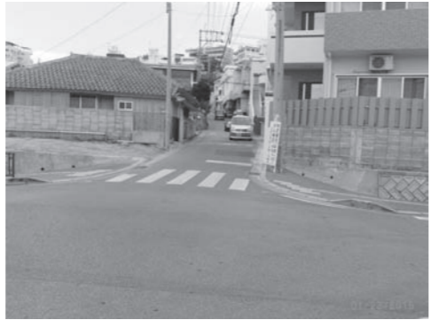
通学路の安全対策は急務！

問 当該関係権判者による相続手続きに時間を要し、土地取得及び物件補償交渉が行えてない。 答 当該関係権判者による相続手続きに時間を要し、土地取得及び物件補償交渉が行えてない。