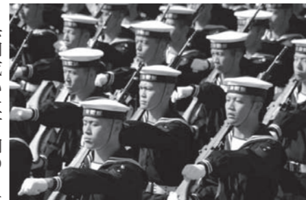
町内の自衛官採用状況は

問 県内或いは町内の5年間の採用状況は。 答 県内の採用状況として、平成21年度は90人、平成22年度は143人、平成23年度は130人、平成24年度は237人、平成25年度は241人。