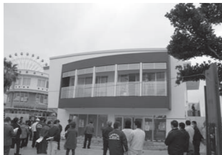
オープンした観光情報センター

問 5月のゴールデウイークから案内業務を開始、窓口案内件数は1万2千238件、月の平均は1千748件。最も利用者が多い時間帯は午後3時以降、スタッフは常時3名を配置。