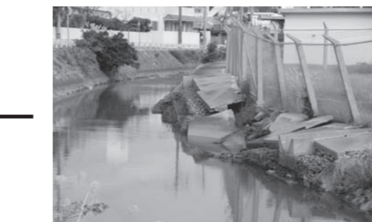
始まる白比川の改修

問 町内の採用状況は、平成21年度は7人、平成22年度は1人、平成23年度は2人、平成24年度は6人、平成25年度は1人。 問 県内の高校及び地元北谷高校の防衛省による防災とか進路講話等の学校説明会の状況は。 答 防災講話は、平成24年度に浦添商業高校、那覇西高校、平成25年度に伊良部高校、嘉手納高校で行われた。進路講話は、平成25年度に宮古総合実業高校で行われた。学校説明会は、平成23年度に沖繩尚学高校、平成25年度に北谷高校、南風原高校、沖繩尚学高校、八重山農林高校、平成26年度に興南高校、沖繩尚学高校、昭和薬科大付属高校、宮古高校で行われた。