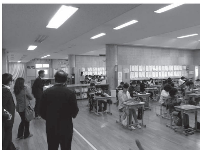
オープン教室のメリット・デメリットは

問 2号認定と3号認定の保育時間の設定、現在、実施されている通常の保育時間、月曜日から土曜日までの保育開始時間と延長保育時間の開始