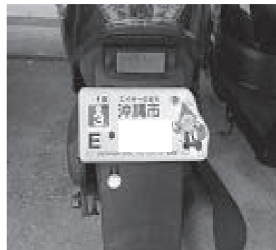
ご当地ナンバー制度は

教育行政 問 子どもの安全管理対策、通学路の安全確保対策について問う。 答 危機管理マニュアルを作成・活用し、交通安全教室、地域安全マップの作成や校内研修等を実施し交通安全の充実に努めている。