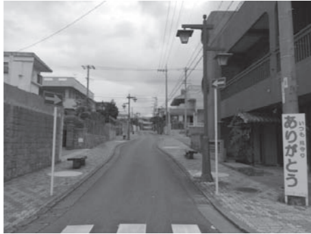
歩行者を優先するふれあい通り

A 歩行者を第一に考え、車道は車両の速度を減速させることを目的として蛇行した形状を取り入れ、植樹やベンチなどを配して快適な歩行者空間を確保した整備