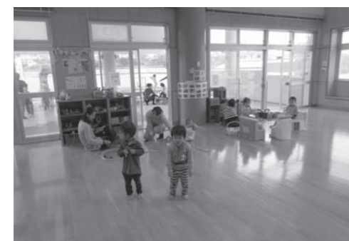
子ども子育て新制度の影響は