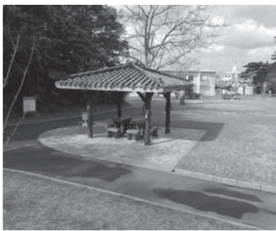
灯りがほしい東屋

問 移住受入協議会の機能を問う。 答 沖繩県は人口増加計画の一つとして、社会増を拡大する取り組みに「移住受入協議会(仮称)」の発足を計画している。 「移住受入協議会(仮称)」の詳細は示されておりません。