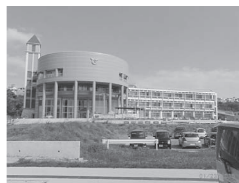
町政人事の適正配置は

問 早期発見、早期対応とともに、医療、介護サービスが有機的に連携し、認知症の容態に依りて切れ目なく提供できる循環型のシステムを構築すること、認知症高齢者等にやさしい地域づくりに向けて省庁横断的な総合的な戦略とすること、認知症の方、ご本人やその家族の視点に立った施策を推進していく。