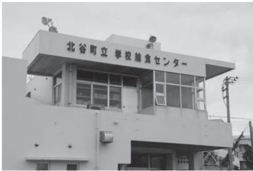
立て替えが決まった給食センターの設備は

問 コスト削減の為、デリバリー方式が採用され、不満が殺到しているという声を聞くことがあるが、食育の意味からも炊飯設備の維持は必要だと思ふが。 答 北谷町立学校給食センター施設整備事業の基本構想から検討課題として引継ぎ、現在、炊飯設備の有無による効果や影響などについて、調査検討を進めている。 問 本町の①児童生徒②職員の朝食の摂取率は。 答 ①小学校1年から中学校3年生を対象に行った調査で、小学校で「毎日食べる」児童は1千697人(87%)で、昨年度86.2%、「食べる」と「多い」児童は185人(9.5%)、昨年度は9.3%でありました。中学校は「毎日食べる」と回答した生徒は765人(79.9%)で、昨年度76.7%、「食べる」と「多い」生徒122人(12.7%)、昨年度は9.3%。各小中学校とも昨年度より今年度の摂取率は高まっている。 問 アンケートの調査はしていない。