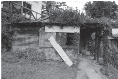
空き家の防災防犯対策は

問 小規模保育事業等、認可外保育園の説明会で、手を挙げた認可外保育園は1園以外にありましたか伺う。 答 現在、事業実施に向け調整を行っているのは、中央保育園のほか1か所となっている。 問 保育料算出基準と負担増になる方もいるか伺う。 答 保育所保育料については、現行の保育料を基に定め、世帯の構成等により多少の変動が生じる可能性はあり、大きな負担増にはならないと考えている。 問 公立幼稚園、預かり保育の希望者は全員入園できるか。今後3歳、4歳児の幼稚園入園計画を伺う。 答 預かり保育につきましては、5歳児の保育に欠ける世帯の園児の希望者全員を受け入れていく予定とする。 問 3、4才児の公立幼稚園受け入れは、平成27年度、浜川幼稚園の4歳児保育の試行を皮切りに、子ども子育て会議において策定を進めている「子ども子育て支援事業計画」において検討を行いながら、3歳児まで受け入れ枠を拡充して行く予定。 問 来年4月、スタート時の待機児童の予想は、今後の対策を伺う。 答 平成27年度の保育所入所申し込みの受付期間等について、例年よりも、申込件数は増加すると見込。 問 平成26年度中の認可保育園の施設整備等に、定員が平成26年4月の660名から、平成27年4月には、129名増の789名となることから、申込期間中である現段階において、待機児童数の予測は困難。