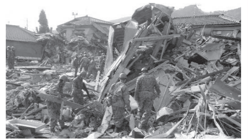
自衛隊による災害対策

問 自衛官の緊急患者の輸送等々、北谷町で起こりうる災害対応について認識は。 答 自衛隊の災害等に関する活動は、台風、豪雨、豪雪、地震などによる被災地への救援活動や、離島及び過疎地からの緊急を要する重症患者等の搬送など。近年の事例としては、東日本大震災での人命救助活動や復興支援、広島市の土砂災害及び長野県御嶽山の噴火に伴う人命救助活動等が報道等によって周知されている。本町においても、不発弾処理、大規模な災害等に伴う人命救助や復興支援等が必要な不測の事態が発生した場合