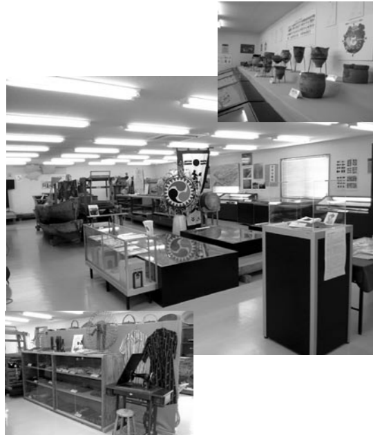
説明員がていねいに対応しています。文化財展示室。

問 ①伊礼原遺跡整備のスケジュール。②職員体制は。 答 ①平成22年度、伊礼原遺跡保存管理計画策定委員会を設置し、平成23年度用地取得。平成24年度から平成30年度にかけて基本設計・実施設計整備。整備と並行して部分 問 公開を行い、平成31年度に博物館の開館とともに公開する。 答 ②現在、埋蔵文化財発掘調査等を係長、専門職員4人、嘱託員等の職員体制。将来、職員体制を十分把握した上で検討する。 問 桑江地区で見えさせた原石（印部石）の文化財としての保存の考えは。 答 専門の方々の意見を聞き入れるとともに、地域の意見を伺いながら、北谷町文化財調査審議委員会に諮っていく。