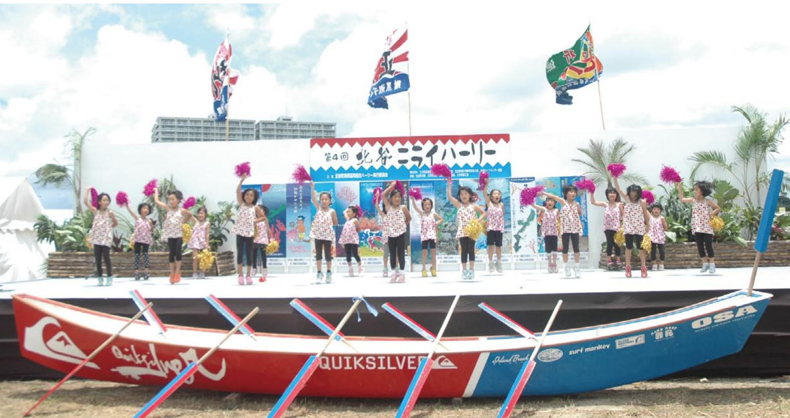
北谷ニライハーリーを盛り上げる宮城児童館ダンスクラブの子どもたち