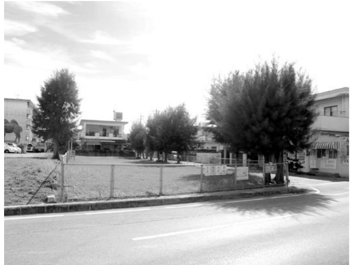
児童デイサービス事業所予定地

問 本町の支給対象人数、経済効果及び当該手当の差押え時の対応は。 答 支給は、2千718世帯、対象児童数4千767人。経済効果を見込むことは難しい。差押えできない旨金融機関等に対し制度の周知を図る。 問 使途等のアンケート調査をし次年度の政策に活かしてはどうか。 答 他の調査資料を活用していきたい。今後は国の動向を注視していく。