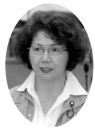
タマナ ヒデコ 玉那覇 議員