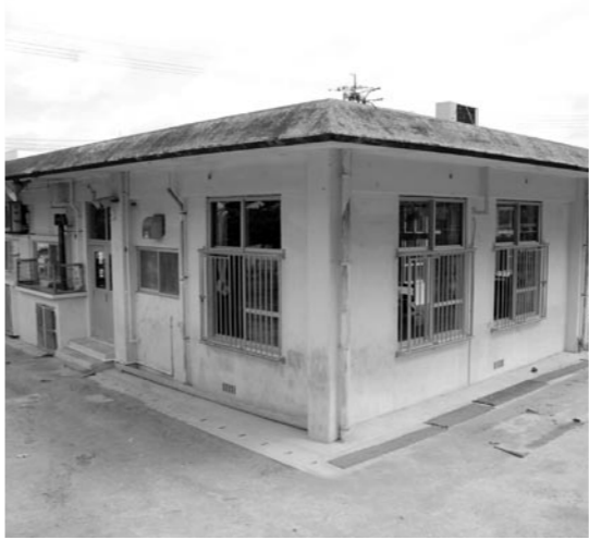
栄口保育所と統合が予定されている上勢保育所

問 ①認可外保育園に対する本町の支援は。②今後、町単独の助成事業は。 答 ①検尿、ぎょう虫検査の実施、町内在住の利用児童一人当たり月額1千円の教材費を助成。②実施可能な支援施策や財源の確保について検討していきたい。 問 認可外保育園に対し、公共施設の減免はできないか。 答 認可外保育園に対し、窓口ネットワークシステムで住民サービスをする