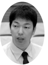
ワタナベ マサ浩 議員