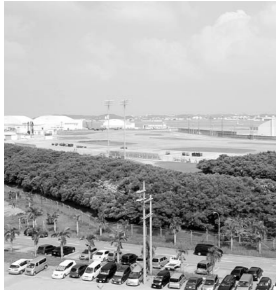
米軍基地から派生する諸問題は

問 住民サービスや費用面で十分効果が期待できるものを積極的に検討していきたい。答 住民サービスや費用面で十分効果が期待できるものを積極的に検討していきたい。