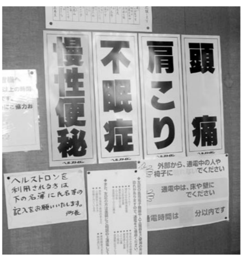
老人福祉センターでのヘルストロン効果の周知啓発

問 ヘルストロンの稼働率と啓発・啓蒙は十分か。答 ヘルストロンの稼働率は十分か。