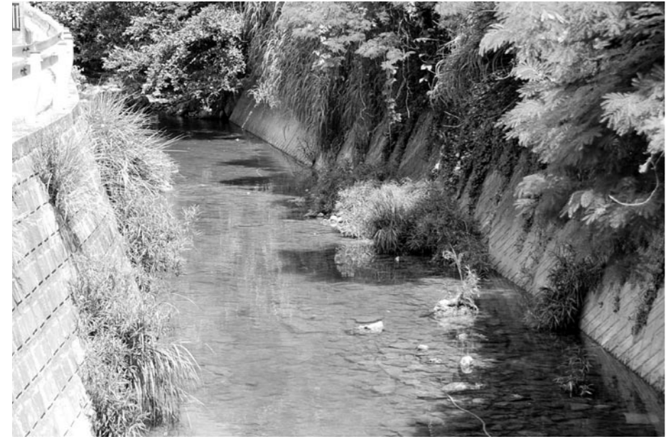
早急な改修工事が必要な白比川

問 日米合意は、瑞慶覧基地等を優先的に返還するとしたが、具体的な場所と時期について、国、県から説明はあるか。 答 返還面積及び返還時期についての説明はなく、共同声明の形式的な説明に止まっている。 問 30年以上前に返還合意がなされているが、返