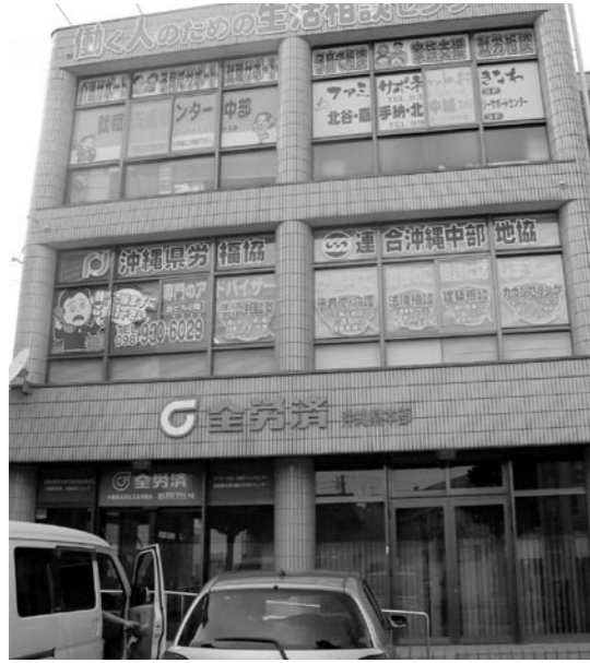
北谷町・嘉手納町・北中城村の合同ファミリーサポートセンターがなぜ沖縄市に？

答 ①面談は275件で、実施率は82.8%。②母子保健推進員が21人で保健師も1人増の3人体制で対応可能。③推進員が訪問カードに記載し会議を経て、フォローが必要な家庭を抽出。報告を受けた家庭は、保健師や社会福祉士が訪問。④ハイリスク妊産婦に若年、高年、経済的支援を要する妊産婦に保健師が各種相談、支援を実施。